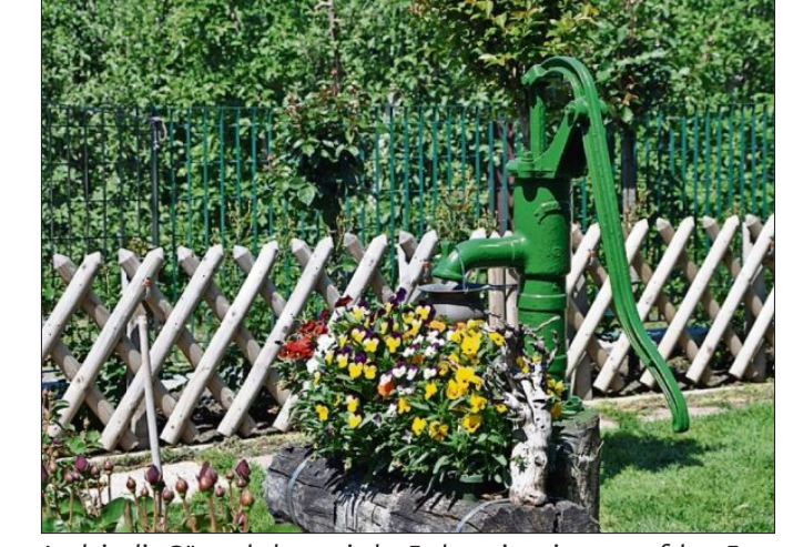
Auch in die Gärten kehren wieder Farben ein, wie man auf dem Foto von Leo Erschbaumer aus Gargazon sehen kann.

Schicken Sie uns Ihr besonders gelungenes Lieblingsbild!